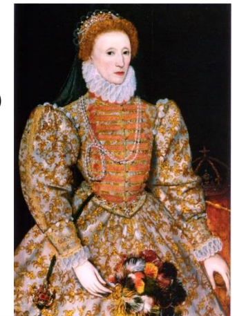
Elizabeth I ère , cousine de Marie Stuart Reine d'Angleterre et d'Irlande 1558 - 1603