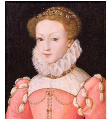
Marie Stuart, petite nièce d'Henry VIII Reine d'Ecosse 1542 - 1567